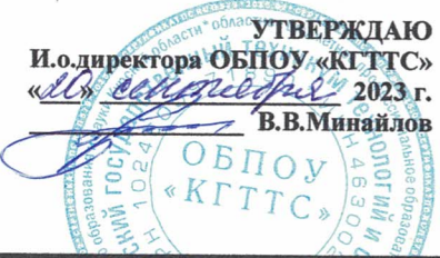
ГРАФИК учебного процесса 4 курса заочной формы обучения по специальности 19.02.10 Технология продукции общественного питания на 2023-2024 учебный год